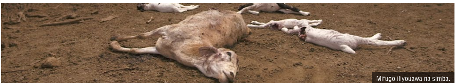
Mifugo iliyouawa na simba.

Sasa hivi simba anaishi kwa kutegemea uhifadhi, huku idadi kubwa ya simba wakiishi ndani na pembezoni mwa Maeneo Yaliyohifadhiwa (PAs). Hifadhi za taifa, mapori ya akiba pamoja na maeneo mengine ya wanyamapori yanayolindwa ni muhimu kwa uhai wa spishi hawa. Japokuwa wanalindwa kwenye karatasi, hifadhi nyingi bado ziko dhaifu kwa vitisho vile vile vinavyojitokeza kwenye mazingira yanayokaliwa na watu nje ya mipaka yao. Kadri jinsi makazi ya binadamu katika uoto wa Savana yanavyozidi kukua, wakati mwingine vijiji huanzishwa pembezoni na ndani ya mipaka ya Maeneo yaliyohifadhiwa (PAs), na mifugo hulishwa pembezoni na mipaka; hii inapelekea katika migogoro isiyoepukika. Migogoro hii inachukua sura kuu mbili. Kwanza, mifugo inayokula kwenye Maeneo Yaliyohifadhiwa hushindana na mawindo ya simba jambo ambalo linaweza kupelekea kuharibika kwa uoto asilia na hivyo kusababisha kupungua kwa idadi ya wanyama asilia wala nyasi. Pili, ni rahisi kwa simba kukutana na mifugo ya nyumbani na huweza kupelekea mifugo kuuliwa. Jambo hili husababisha vifo vya visasi kutoka kwa wafugaji na wahifadhi pori. Uvamizi wa watu na mifugo yao kwenye Maeneo Yaliyohifadhiwa na shinikizo kwa simba sasa hivi inachukuliwa kuwa moja ya vitisho vitatu dhidi ya spishi hii katika Afrika Magharibi, Mashariki, Kati na Kusini. 27 Uvamizi wa binadamu pia unahusishwa na uwindaji haramu wa nyama pori—tishio lingine kubwa kwa simba na mawindo yao.