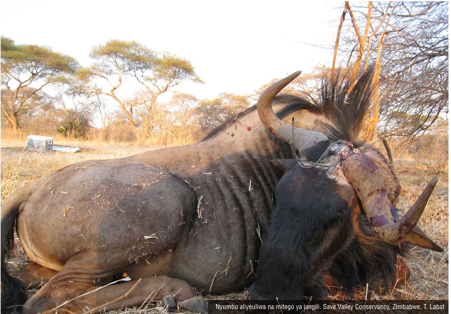
Nyumbu aliyeuliwa na mitego ya jangili. Save Valley Conservancy, Zimbabwe. T. Labat