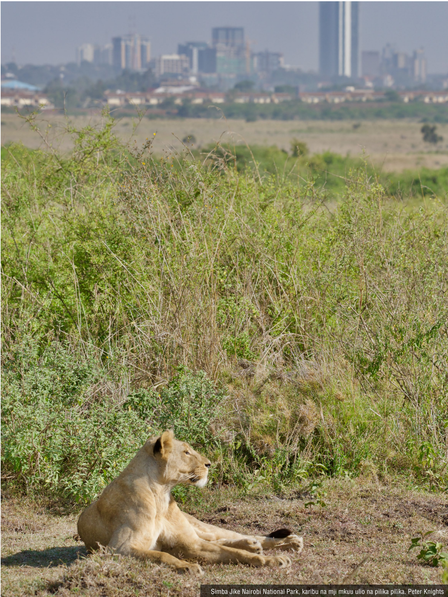
Simba Jike Nairobi National Park, karibu na mji mkuu ulio na pilika pilika. Peter Knights