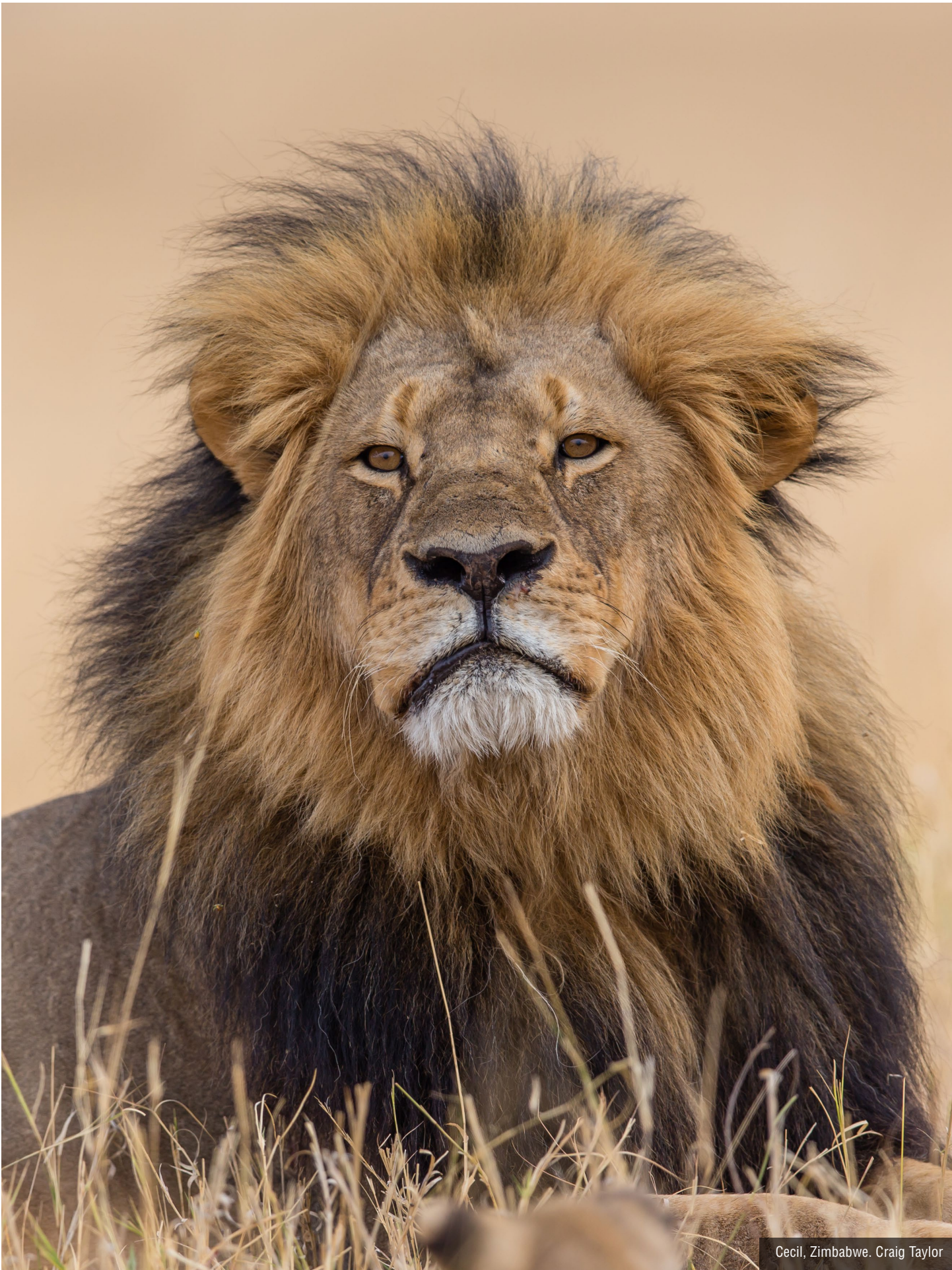
Cecil, Zimbabwe. Craig Taylor